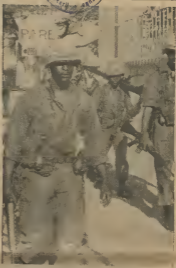
E CRISIS NA REP. DOMINICANO A MENGUA POCO

fuera di industria di petroleo. Tabata evidente cu si es industria di fertilizante nobo mester ser un costo e leña competitivo nba plaza mundial, pago y beneficio di industria petroleo na por ser considera como un ejemplo pa es planta nan nobo, pasobra ta bon conoci cu tal pago y beneficio por lo regular ta mucho mas halto cu es nan di otro industria, incluyendo industria di fertilizante. Ademas, ta bati peca cu suficiente personal di cualidad halto por a ser atrae door di ofrece condicion nan di empleo algo mehor cu es nan cu ta existi generalmente den otro industria di trabao den Aruba, excluyendo industria petroleo. Cu e posturamentu aki tabata cuerto por ser logra for di es cantidad grandi di bende cu a aplica pa trabao y for di cual compania a selecta su empleadon nan cu e tin actualmente. Cada un di bostan, empleado nan actual di A.C.I. a ser emplea cu un conocimiento bon dia di es pago y